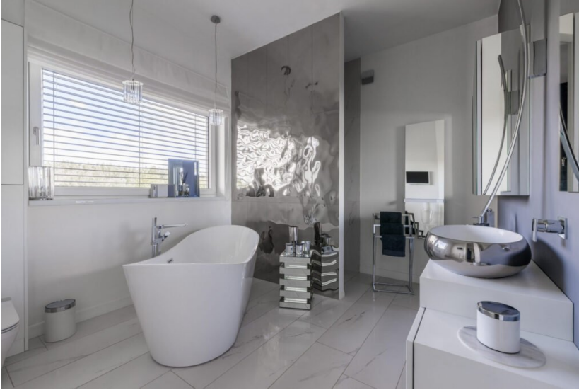
Eine Galerie unterschiedlichster Baddesigns.

„Quiet luxury“ setzt 2026 auch im Badezimmer Akzente. Der Begriff steht für ein Designkonzept, das auf die Vereinigung schlichter Formen und hochwertiger Verarbeitung steht. Die Farbtöne sind warm, Materialien wie Stein und Holz spiegeln die Nähe zur Natur wider. Im Badezimmer ist das Ziel, einen Raum für die Entschleunigung des Alltags zu kreieren. Weiche Formen und Rundungen sorgen für Harmonie und mehr Wohnlichkeit. Farben dürfen auch mal dominieren, hier sind vor allem matte Oberflächen gefragt. Bei alledem kommt jedoch auch die Funktionalität nicht zu kurz. Der persönliche Rückzugsort soll in allen Belangen so angenehm wie möglich sein.