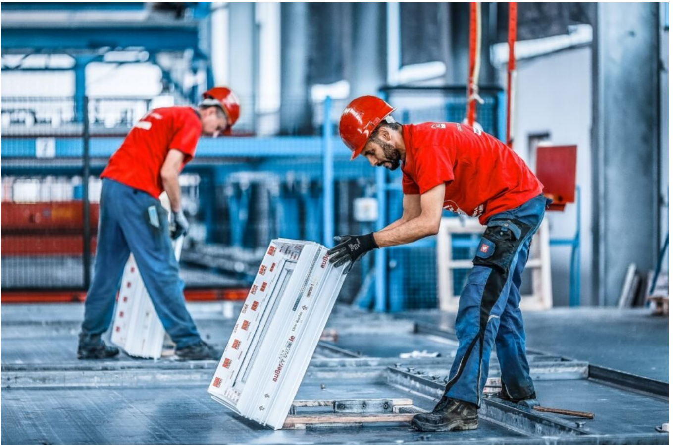
Einlegen der Einbauteile im Werk