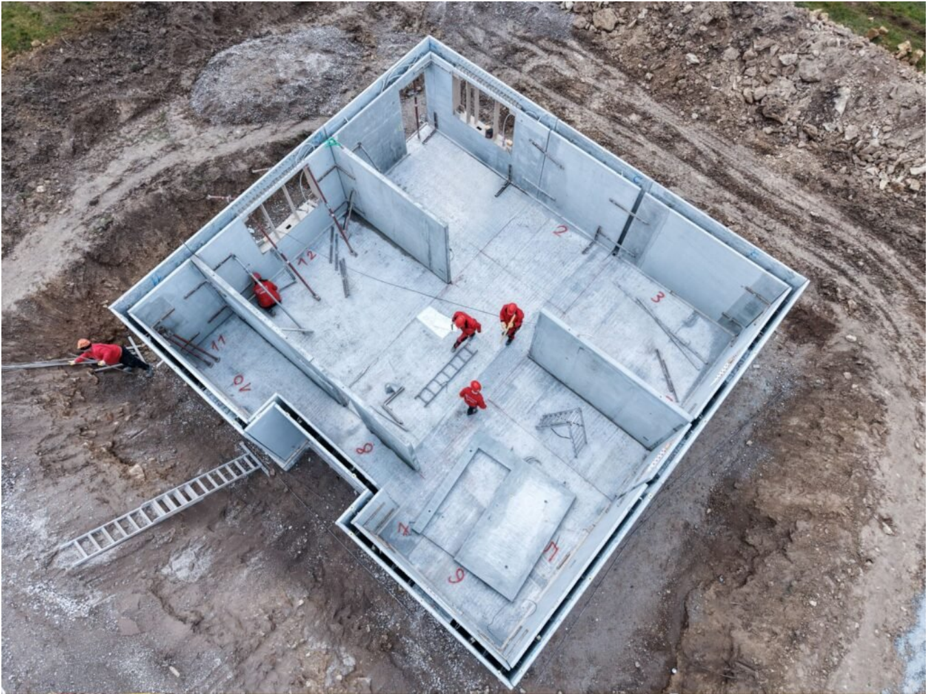
Kellermontage auf der Baustelle