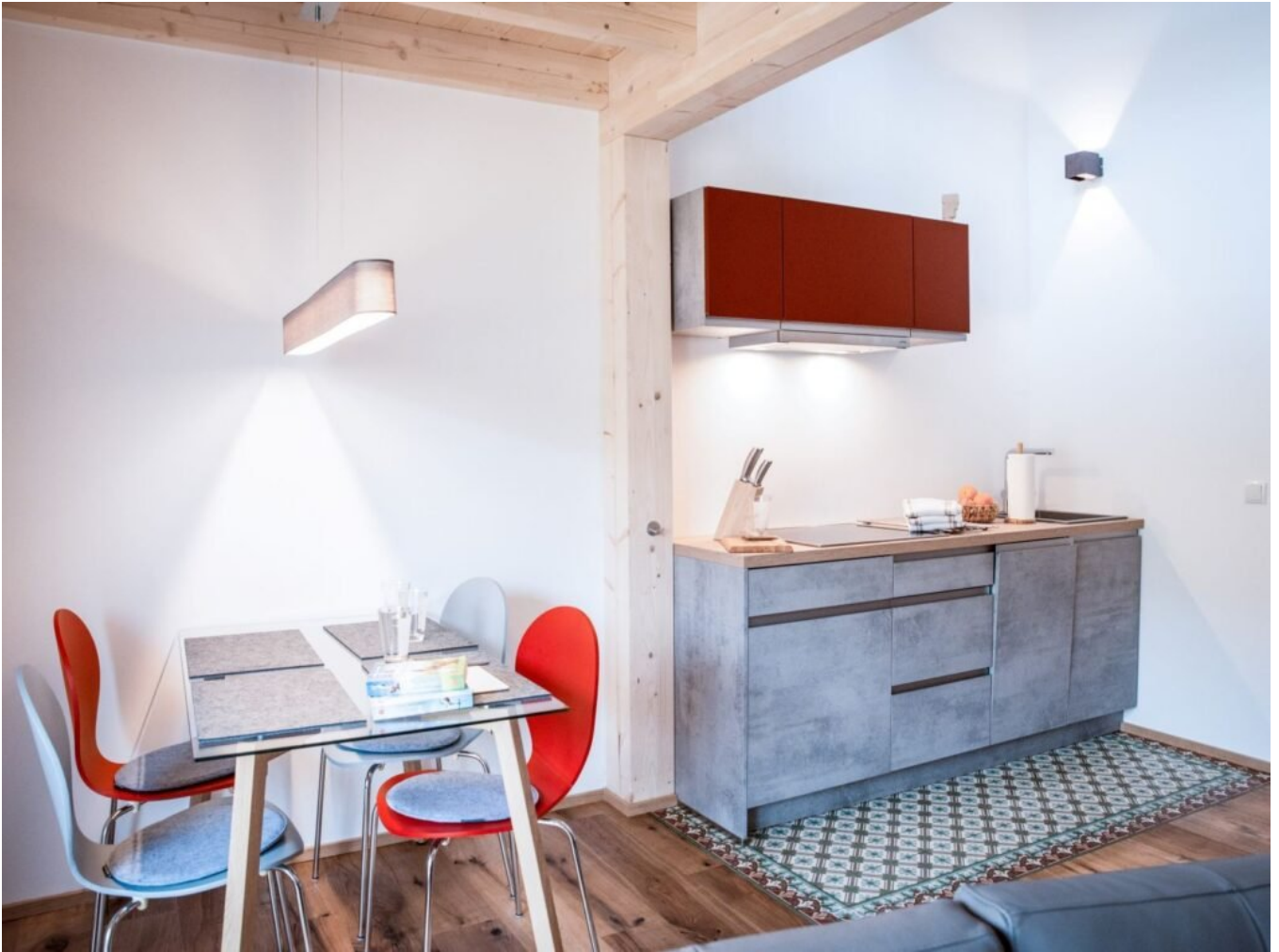
Wohnbereich im Keller.