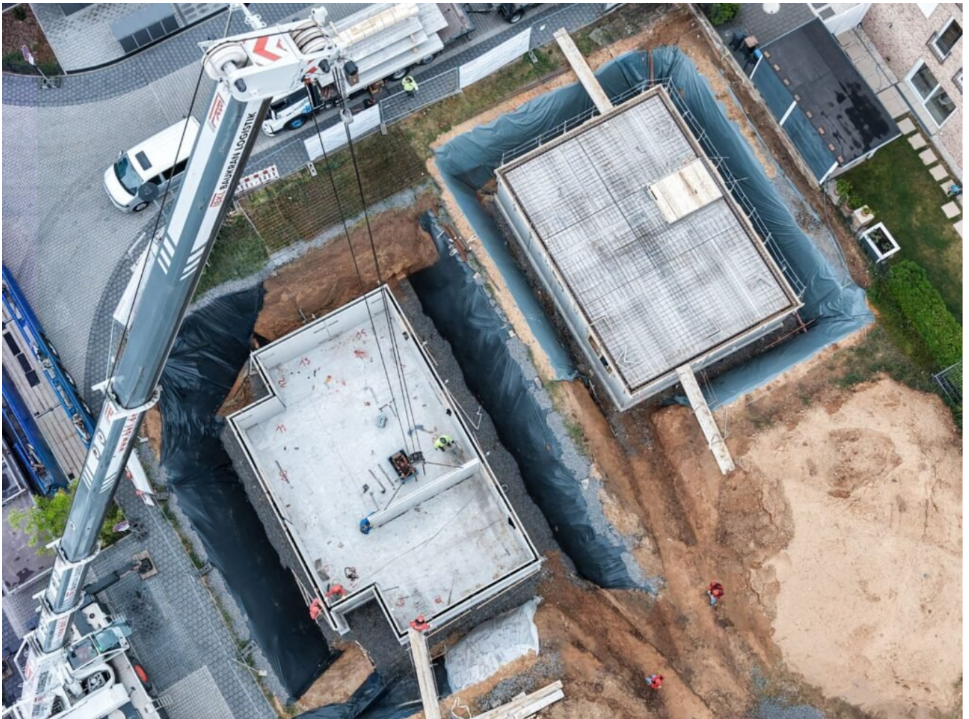
Das 90.000 Bauvorhaben von Glatthaar Keller

Das Ergebnis ist ein durchgängiges Baukonzept, bei dem Keller und Haus optimal aufeinander abgestimmt sind - von der Planung bis zur Fertigstellung.