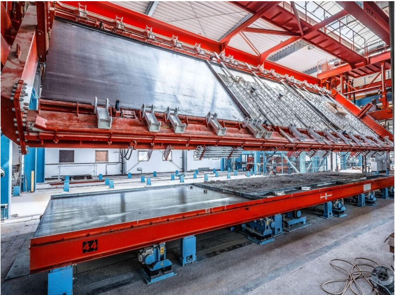
Industrielle Vorfertigung im Betonfertigteilwerk

Industrielle Vorfertigung im Betonfertigteilwerk Kellermontage auf der Baustelle Wohnbereich im Keller