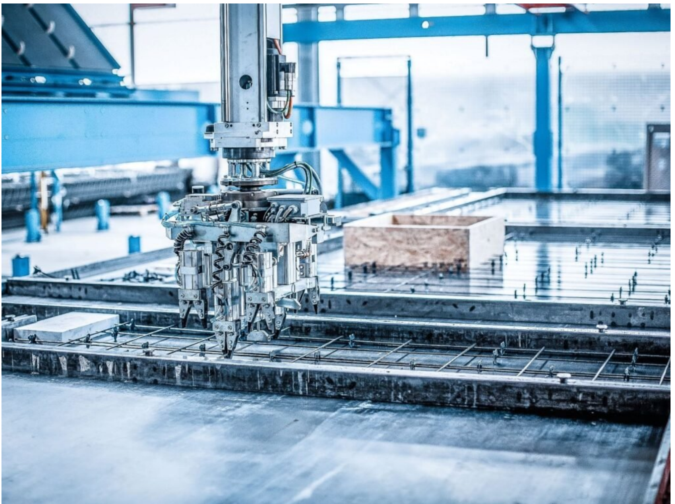
Einlegen der Bewehrung

Durch klare Abläufe und abgestimmte Prozesse lassen sich Bauzeiten besser einhalten und Kosten verlässlicher kalkulieren.