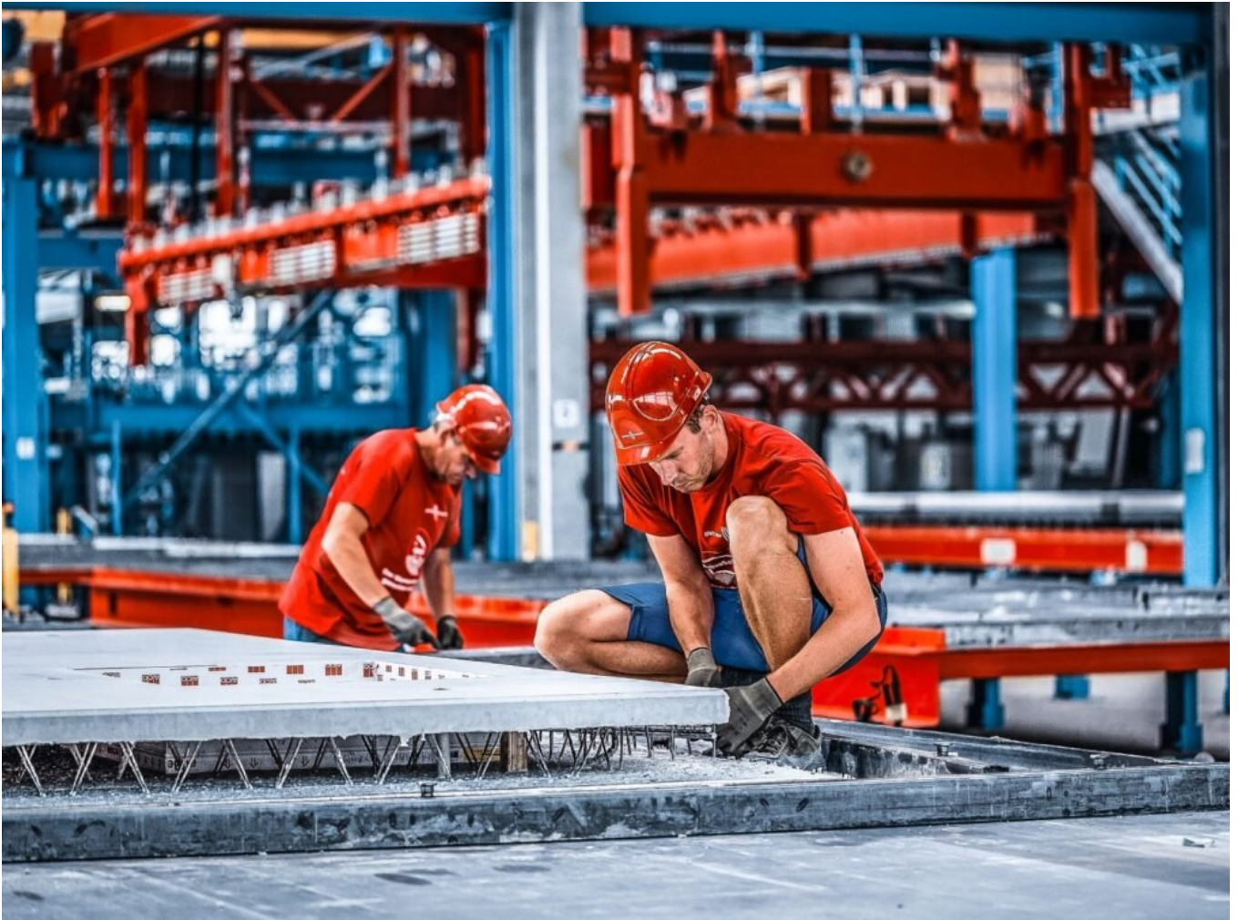
Ausschalen der Elemente