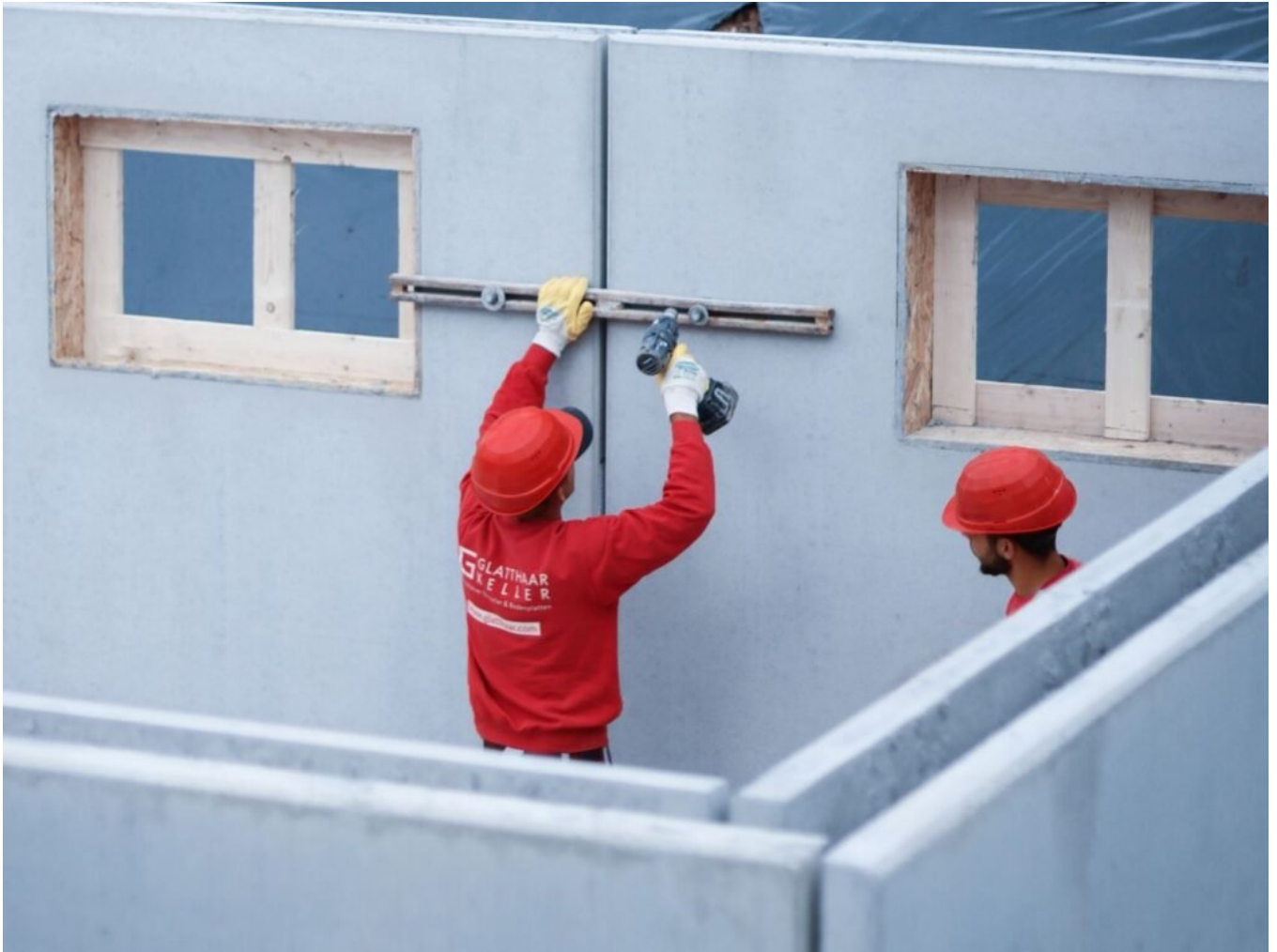
Teamarbeit auf der Baustelle