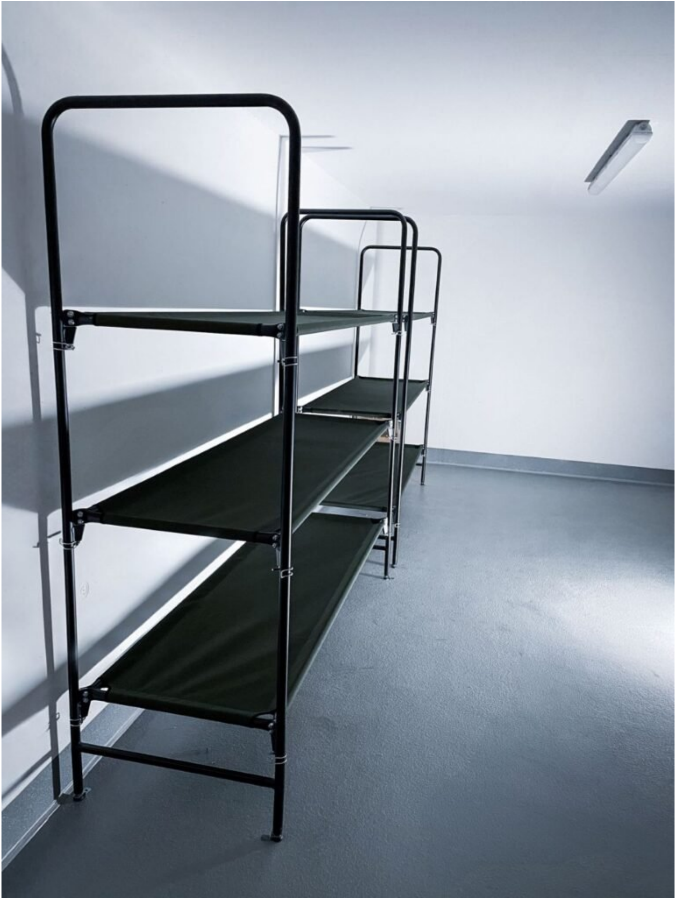
Schutzraum im Keller