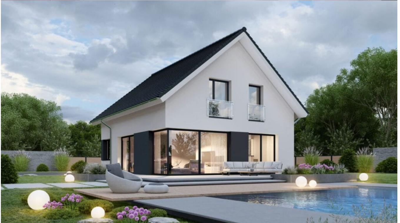
Das „Point 153 S“ punktet als flexibles Familienhaus neben großem Wohn-Essbereich mit Zusatzzimmer und angrenzendem Bad im Erdgeschoss, mit geräumigem Familienbad, zwei gleich großen Kinderzimmern sowie Elternschlafzimmer und begehrter Ankleide im Obergeschoss.